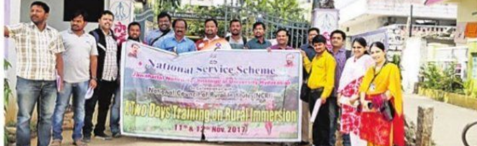
గ్రామాల్లో పర్యటిస్తున్న ఎన్సీఆర్ఐ బృందం సభ్యులు

మేద్చల్రూరల్: నేషనల్ కౌన్సిల్ ఫర్ రూరల్ న్నారు. అనంతరం బృంద సభ్యులు గ్రామ అభి ఇన్స్ట్రీట్యూషన్ గ్రామస్తులను అడిగి సమస్యలను తెలుసుకు శాలల ప్రోగామ్ ఆఫీసర్స్ పాల్గొన్నారు.