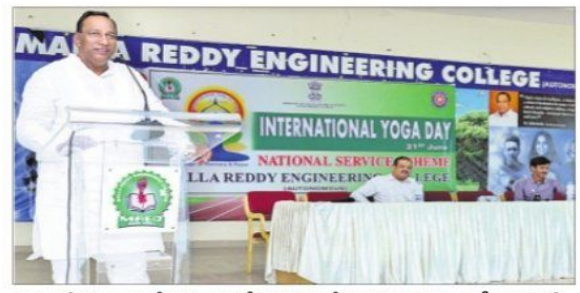
మల్లారెడ్డి కళాశాలలో యోగా బినోత్సవ సభలో మాట్లాడుతున్న ఎంపీ మల్లారెడ్డి